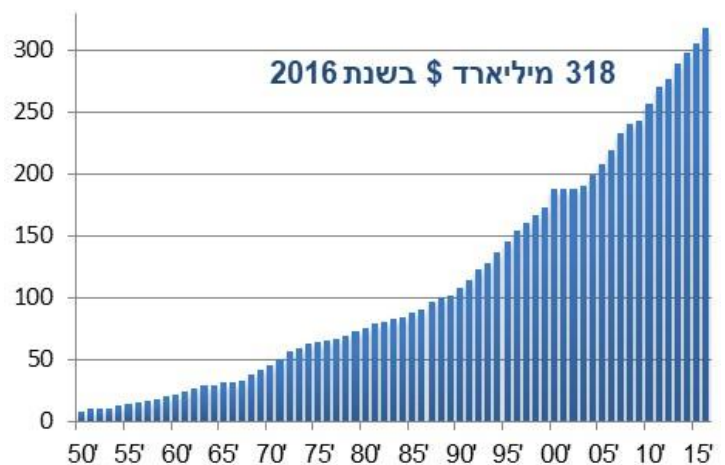
התוצר מהקמת המדינה ועד היום מיליארדי $ של 2016

לעלייה המרשימה מכמעט אפס תוצר ל-320 מיליארד $, בתוך 70 שנים, אין אח ורע בעולם. אין עוד מדינה בתבל שבה האוכלוסייה גדלה פי 13, והתוצר לנפש גדל פי 7.5, בתוך שבעים שנה. וכל זאת כאשר המדינה נלחמה על קיומה, צבאית וכלכלית, במשך כמחצית מהשנים לקיומה,